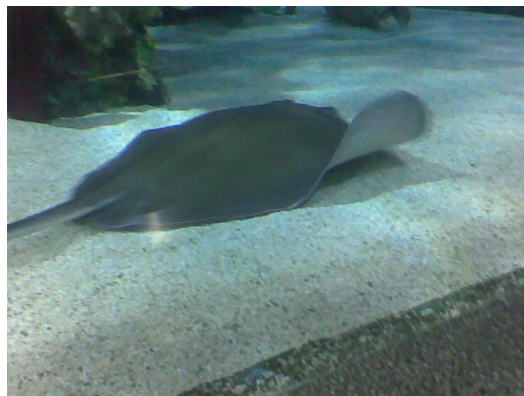
(ez egy rája)

Olvasó! Kívánom, hogy jó egészségben töltsd el és bírd ki ezt a meleg nyarat, sok örömet adva és kapva! Találkozunk az iskolában!